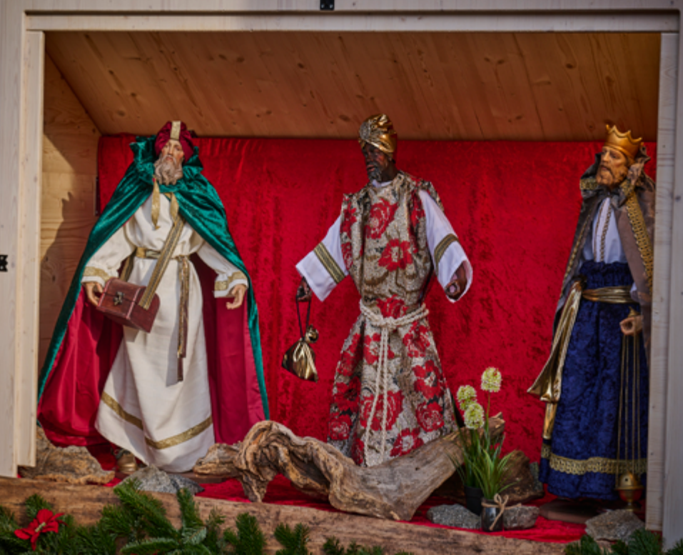
Die Heiligen Drei Könige aus der Dorfkrippe in Weilersbach (Oberfranken). Siehe hierzu auch unser Bericht im TraDi - Trachtler digital vom 1.12.2023