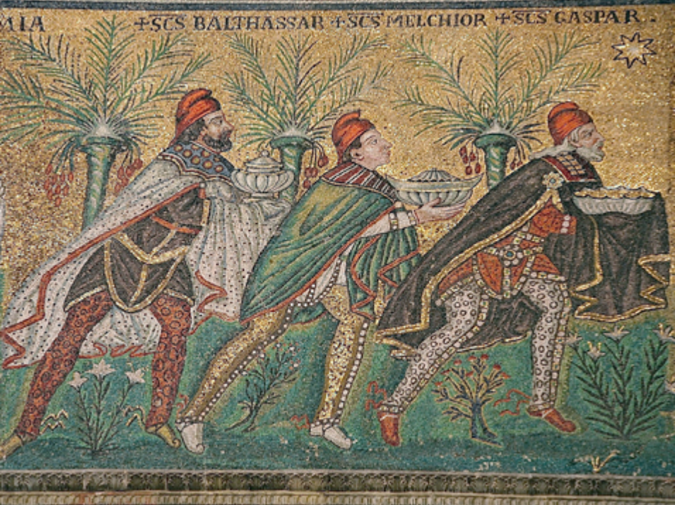
Eine alte Darstellung von Balthasar, Melchior und Caspar in einem Mosaik des 6. Jahrhunderts (Basilica Sant'Apollinare Nuovo, Ravenna). Die drei heiligen Könige tragen phrygische Mützen, ihre Tracht ähnelt der Kleidung sassanidischer Priester.