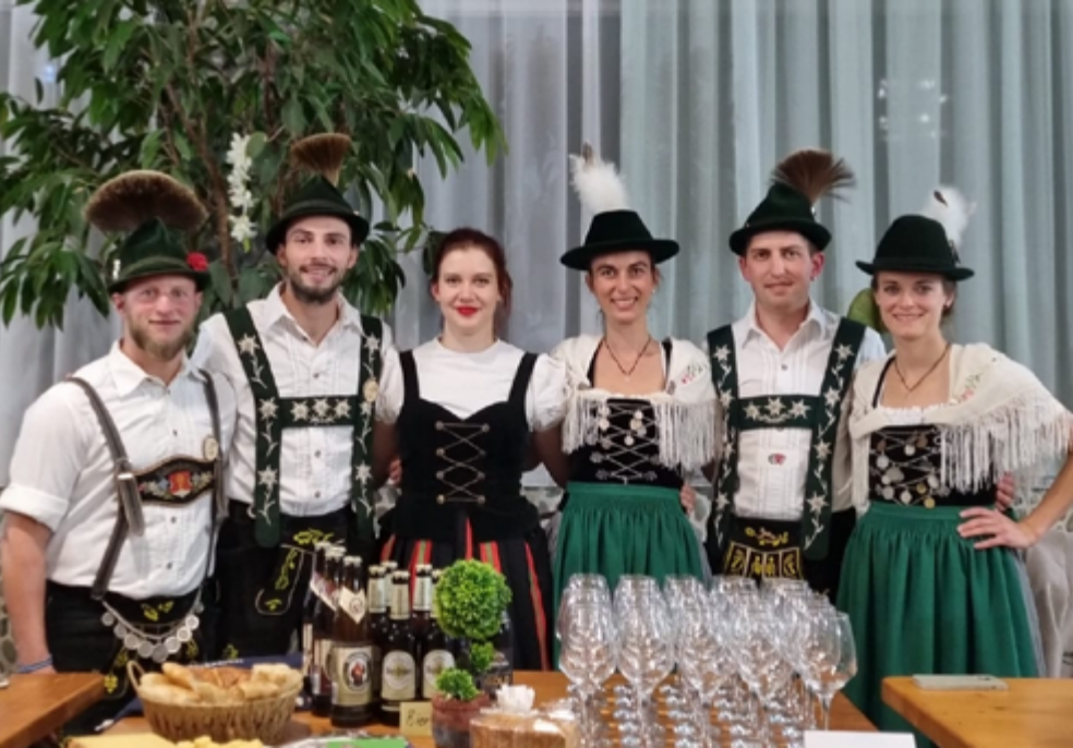
Viel Freude hatten die Allgäuer Trachtler in Armenien.