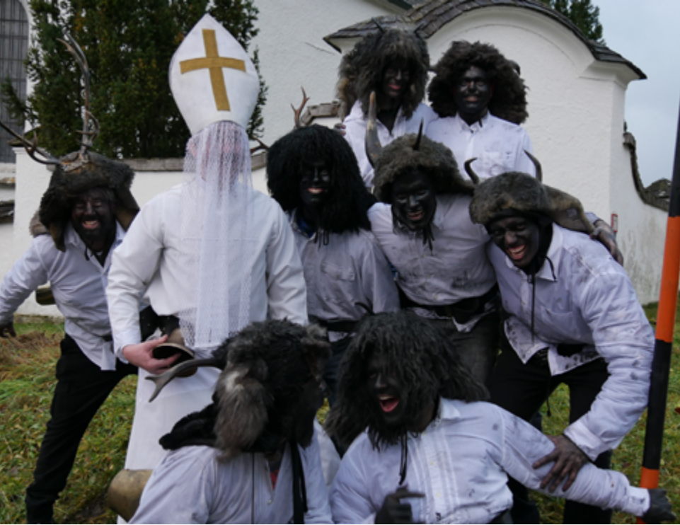
„Vui Glück in Stoi und überoi“ - dieser Wunsch wird von den Bewohnern dankend angenommen.