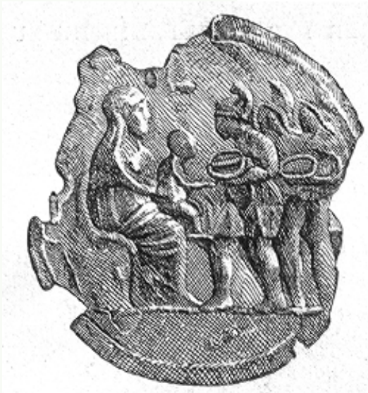
„Die Anbetung der Magier“ Bronzeplakette aus dem 4. Jahrhundert; ausgestellt in den Vatikanischen Museen.